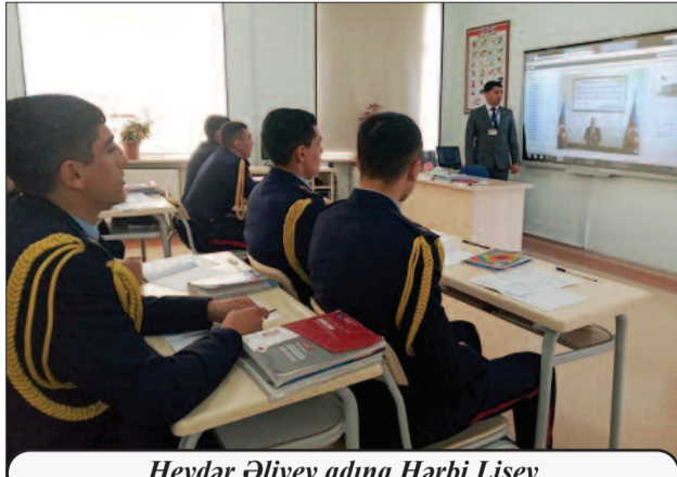
Heydər Əliyev adına Hərbi Lisey