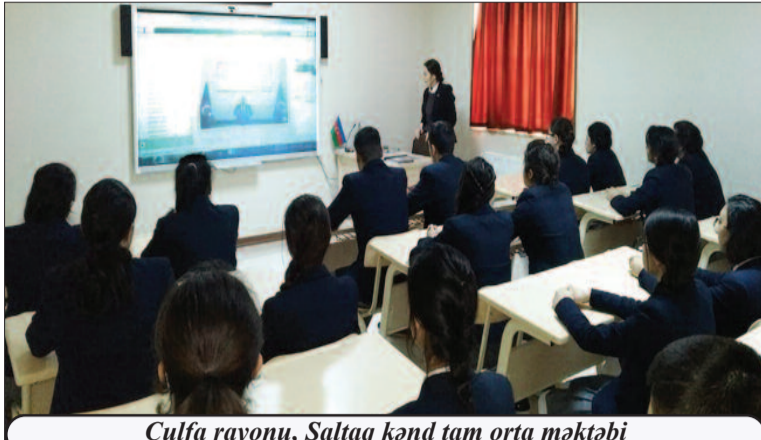
Culfa rayonu, Saltaq kənd tam orta məktəbi

mışlar. Mühasirədən çıxıb xilas olmağa çalışan dinc sakinlər yollarda, meşələrdə xüsusi amansızlıqla qətlə yetirilmişdir.